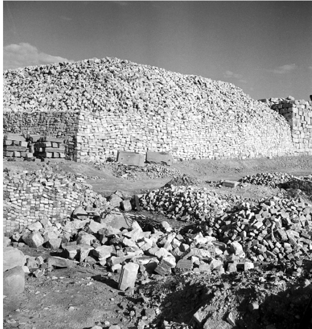
Le Havre – Récupérations de matériaux, 27 juin 1946

170, rue Victor Hugo Le Havre 02 35 43 31 46